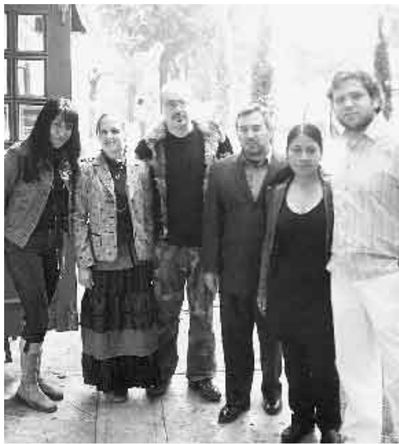
ENTRETENEDORES: Nueva manera de llamar a los actores.