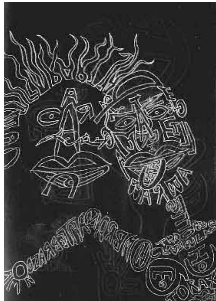
FESTEJOS: La Galería José María Velasco cumple 55 años.

Hipódromo mr (Casa de muñecas) , se estrenará el 3 de febrero, en el Ex Teresa Arte Actual, y tendrá funciones viernes, sábados y domingos, a las 19 horas, hasta el 26 de febrero.